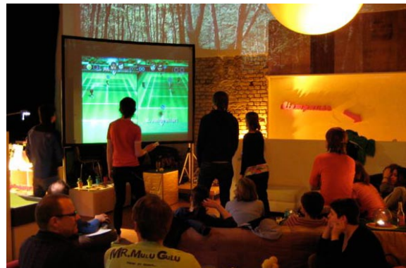
Abendveranstaltung während einer Eventwoche im April 2008

MOTOKI WOHNZIMMER STAMMSTRASSE 32-34 50823KÖLN