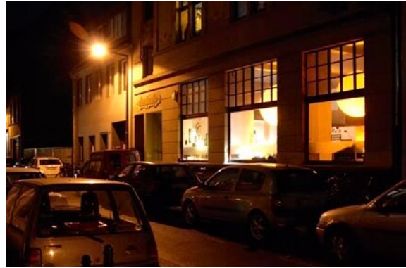
Außenansicht motoki Wohnzimmer am Abend